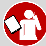
Estación de trabajo en movilidad