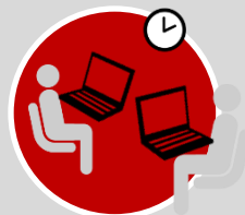
Entornos de Trabajo colaborativo