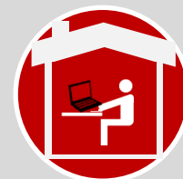
Espacios físicos diferentes