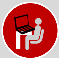
Punto de trabajo digital